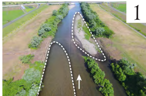
左：拡縮工法の導入前（2016年6月） 右：拡縮工法の導入後（2016年7月）